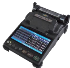
12R 単心～4心 外径調心機