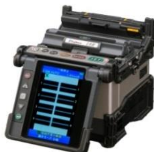
19R 単心～4心 外径調心機