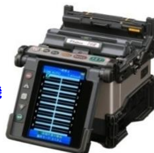
70R 単心～12心 外径調心機